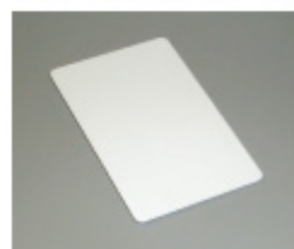
SNT-CM11 Mifare one卡 (13.56MHz)